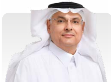
محمد بن يحيى القحطاني النائب التنفيذي للرئيس للتكرير والكيميائيات والتسويق

”حرص أرامكو السعودية الشديد على التميز التشغيلي والموثوقية والسلامة، مهد الطريق لتحقيق أرباح قياسية في قطاع التكرير والكيميائيات والتسويق في عام 2022، والاستفادة من تحسن هوامش أرباح أعمال التكرير. وبفضل إنجازات برنامج التحول في القطاع والنجاح في تنفيذ عمليات الاستحواذ الإستراتيجية، تمكنت الشركة من تعزيز مكانتها كشركة رائدة في قطاع التكرير والكيميائيات والتسويق على الصعيد العالمي.“