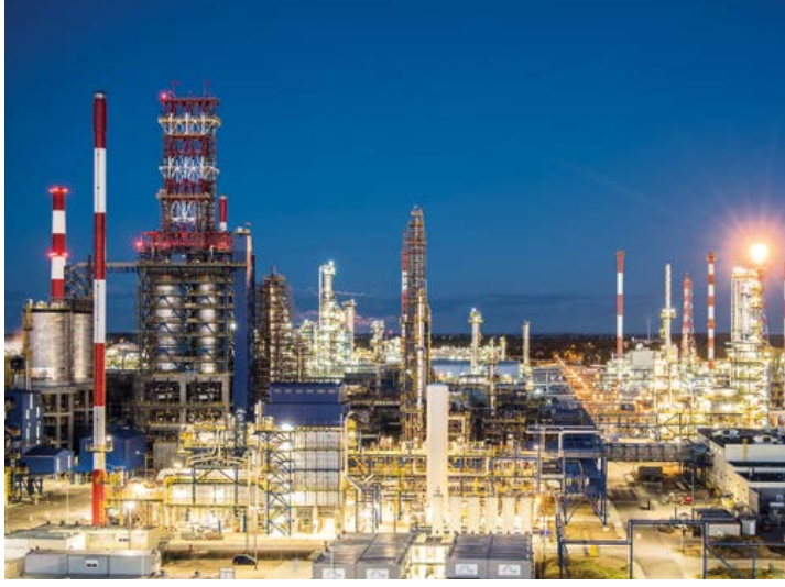
▲ مصفاة غدانسك، بولندا