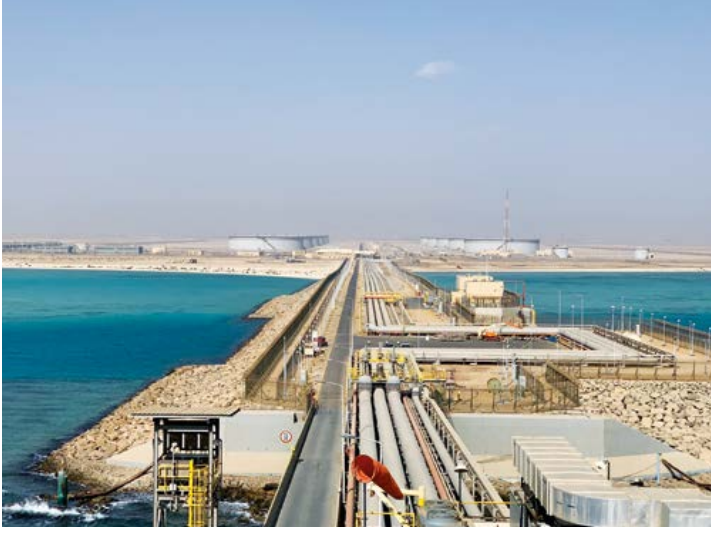
▲ فرضة جنوب ينبع، المملكة العربية السعودية

في فبراير 2022، أنهت الشركة صفقة متعلقة في مجال البنية التحتية للطاقة بقيمة 58.1 مليار ريال سعودي (15.5 مليار دولار أمريكي) تباع من خلالها حصة ملكية نسبتها 49% في شركة أرامكو لإمداد الغاز التي تأسست حديثاً إلى ائتلاف من المستثمرين بقيادة شركة بلاك روك للأصول الثابتة وشركة حسانة الاستثمارية. ستظل أرامكو السعودية محتفظة بالملكية النظامية الكاملة والسيطرة التشغيلية التامة لشبكتها لخطوط أنابيب الغاز، ولا يترتب على الصفقة فرض أي قيود على الطاقة الإنتاجية لأرامكو السعودية من الغاز. وتعكس هذه الصفقة التقدم الكبير الذي يحرزه برنامج تعزيز كفاءة الموجودات في أرامكو السعودية، وتحقيق قيمة إضافية من قاعدة الموجودات المتنوعة في الشركة، وتؤكد التزامها بإيجاد القيمة طويلة الأجل.