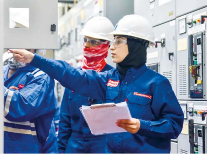
▲ محطة بقيق، المملكة العربية السعودية

ولا تزال الشركة ملتزمة بالتحول العالمي في مجال الطاقة انطلاقًا من نظرتها إلى الطاقة المتجددة كقطاع مكمل لمنتجاتها من الطاقة، مستندة في ذلك إلى الموارد الهائلة من الطاقة الشمسية وطاقة الرياح في المملكة.