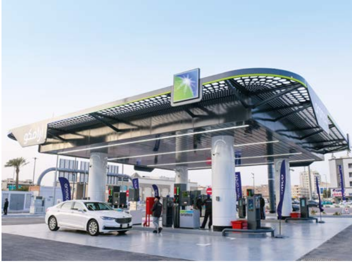
▲ الخبر، المملكة العربية السعودية