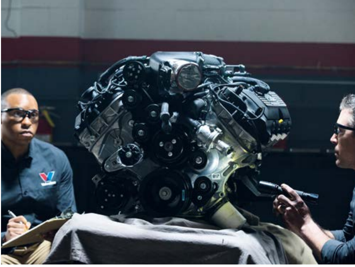
▲ شركة فالفولين، مركز البحوث والتطوير، الولايات المتحدة الأمريكية

وقعت أرامكو السعودية اتفاقية شراء للاستحواذ على حقوق ملكية فالفولين للمنتجات العالمية (فالفولين غلوبال برودكتس) بقيمة 9.9 مليار ريال سعودي (2.65 مليار دولار أمريكي). ومن المتوقع أن يكمل هذا الاستحواذ الإستراتيجي الطريق الذي تنتهجه أرامكو السعودية فيما يتعلق بزيوت التشحيم ذات العلامة التجارية المميزة، ويعزز من قدرة الشركة على إنتاج زيوت الأساس حول العالم، وكذلك سيوسع من أنشطتها وشراكاتها في البحوث والتطوير في هذا المجال، بالتعاون مع شركات تصنيع المعدات الأصلية. وقد أغلقت هذه الصفقة في مارس 2023.